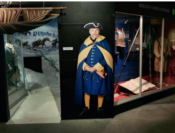
Del ur Karolinerutställningen i "Garnisonen"