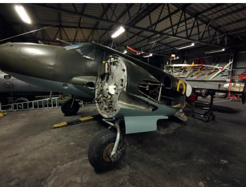
Beechcraft Beech 18R under restaurering, Viggshallen i "Flyg & Lotta"

www.teknikland.se www.facebook.com/teknikland/ www.instagram.com/teknikland/