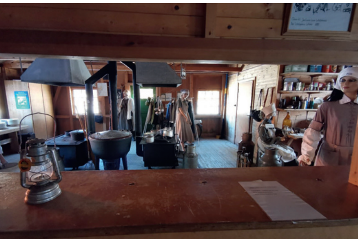
Lottornas kök i "Flyg & Lotta" Här kan man bland annat lyssna på inspelning från en av Lottorna på den tiden det begav sig.