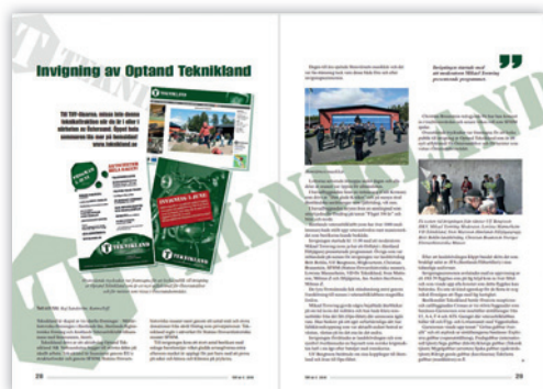
TIFF nr 4/2010 (sida 28-29).

Ändring av bolagsform och sammansättning skedde 2012 och sedan dess har museet fortsatt utvecklats och årligen ökat i besöksantal till idag drygt 8 000 besökare på en säsong.