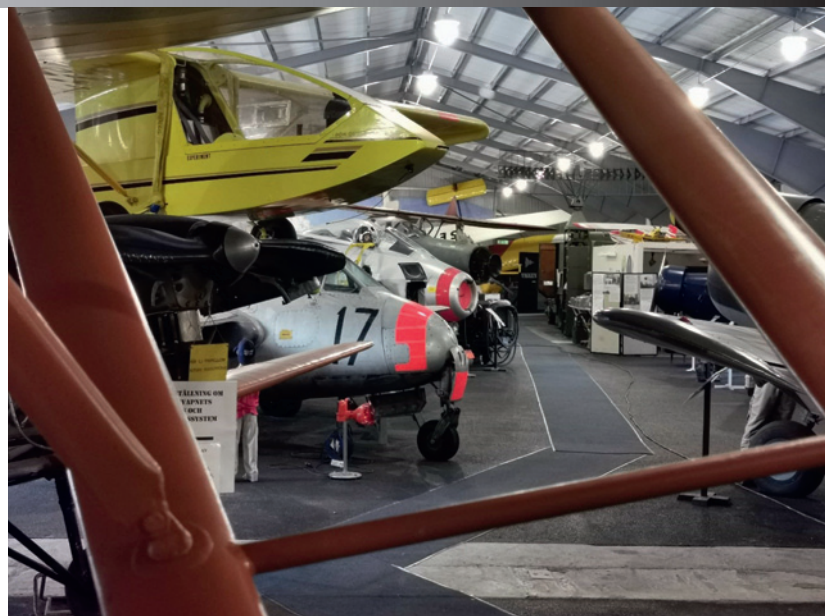
Stora flyghallen i "Flyg & Lotta", totalt finns det ungefär 30-talet flygplan i samlingarna.

inriktad mot teknik, bland annat har man kunnat prova på att skapa i 3D samt bygga och programmera en robot i LEGO. Den verksamheten flyttas under sommarsäsongen in i museet och blir tillgänglig för besökarna.