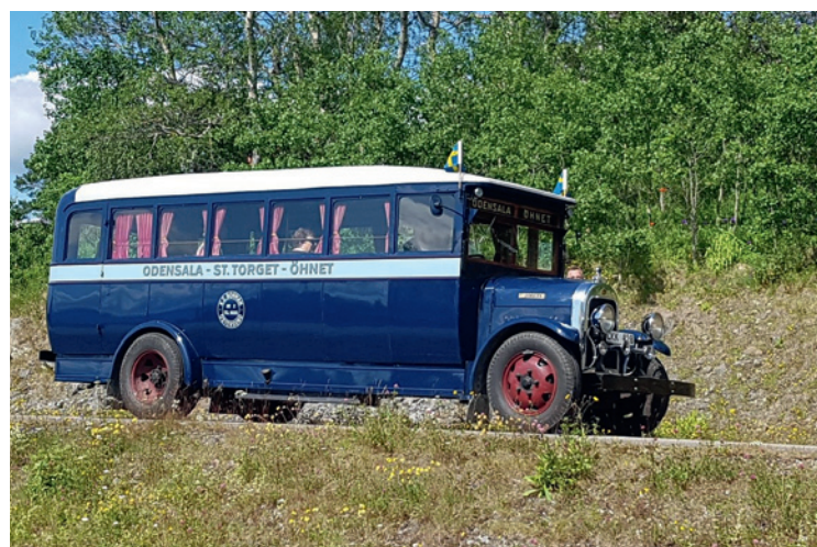
Brockway årsmodell 1929 på besök vid den plats den tidigare stått inbyggd som sommarstuga, bilden tagen sommaren 2019.