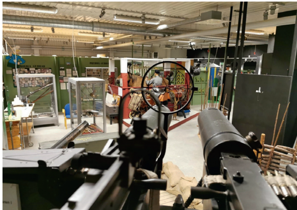
Här kan man prova sikta med KSP m/36, hittar ni flygplanet? Del av vapenutställningen i "Garnisonen"