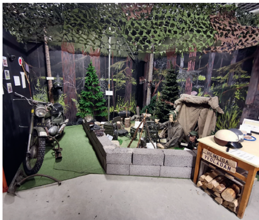
Sambandsdelen i utställningarna i "Garnisonen".

Ett av de årligt återkommande projekten utöver arbete med utställningar är det som man kallar Föremålsprojektet. Inom ramen för det projektet inventeras, dokumenteras och digitaliseras samlingarna från I 5, F 4, A 4 och ATS (Arméns Tekniska Skola) och förs in i databasen PRIMUS.