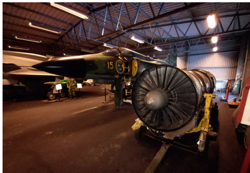
Vigganhallen i "Flyg & Lotta", här med ett drivpaket urplockat.

Teknikland har under några år med stöd från Östersunds kommun även bedrivit ungdomsverksamhet >>>