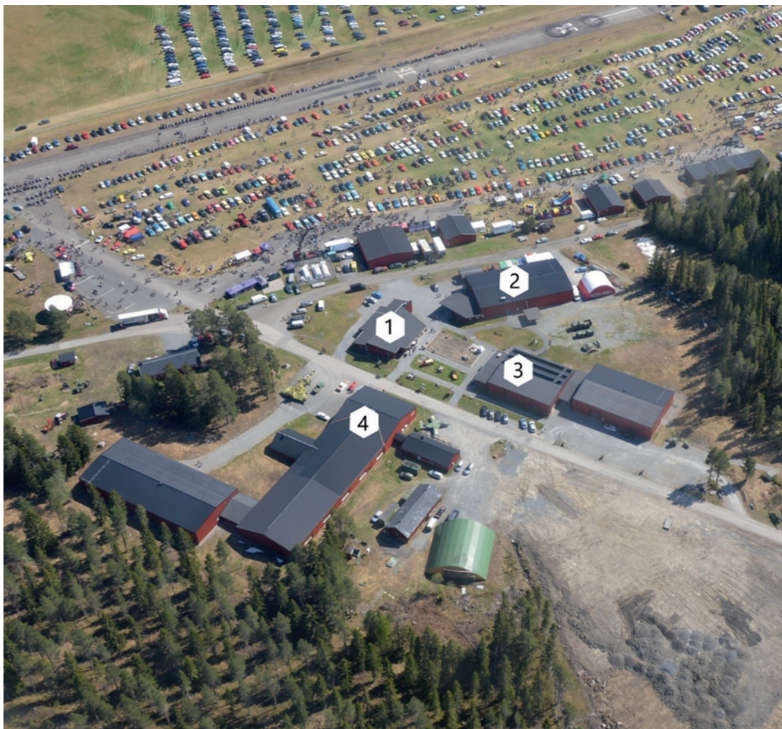
Flygbild över Tekniklandsområdet tagen vid Springmeet 2018. Husen markerade i bilden är 1: Kafe Kronan, 2: Garaget, 3: Garnisonen, 4: Flyg & Lotta.